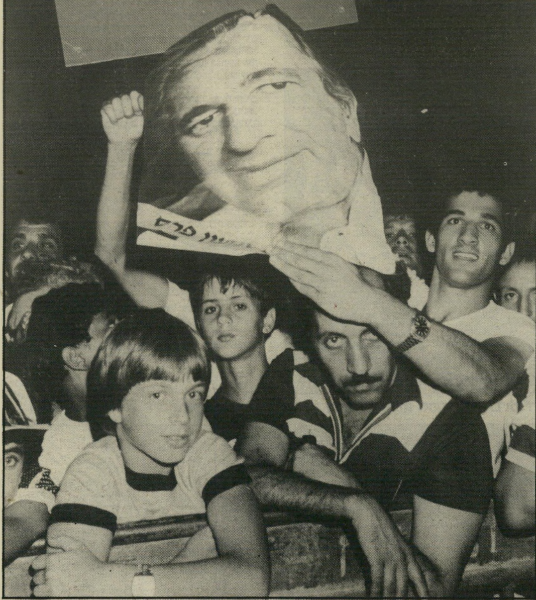
הטראומה של בחירות 1981: כתובות על הקירות (מימין) והפרעות לאסיפות פרס (למעלה)

הסוציאלי בין עשירים ועניים, ובמילא גם בין העדות. בעוד שאנשיהרות הפופוליסטיים השמיעו זעקה דמגוגית גדולה, זכה פרס בתמיכה מאסיבית של השכבות האמידות. שנציגים האמיתי בממשלה היה שרהאוצר יצחק מודעי. האם היתה אלטרנטיבה? רוב הכלכלנים הרציניים, וגם רבים מאישיהציבור הרציניים בימין, הצביעו עליה: קיצוץ ראסטי של תקציביהביטחון, שגדל ללא כל פרופורציה גם בשעה שהכוח הצבאי הגדול ביותר בעולם הערבי — מצריים — פרש מן המערכה. עיראק היתה עסוקה לזמן רב עם איראן, ומול ישראל לא התייצב שום כוח של ממש מלבד הרחליל הסורי, שלא היה לו כל עניין או אפשרות לתקוף.