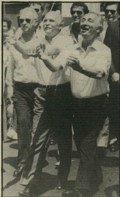
רגע של אושר: במיצעד האחד במאי

פרס לא הלך בדרך זו. לכאורה, היתה לכך סיבה פוליטית-טכנית: הוא לא יכול היה להתגרות ביצחק רבין. באיזון העדין בממשלה, היתה תמיכתו של רבין בפרס חיונית. ורבין, שרצה למצוא חן בעיני קציניו, התנגד בחריפות לכל קיצוץ משמעותי. אך גם כאן נראה שהסיבה הטכנית היתה בגדר אמתלה. פרס עצמו הישקיע בשעתו מאמץ גדול ברכישת אהדתם של קציני צה"ל. לא היה עולה על דעתו לעשות מעשה שיקומם את הקצונה נגדו. ומעבר לזה: כל חייו היה פרס "ביטחוניסט". במשך שנים היה אחראי למשק הביטחוני. הוא התגאה בחלקו המכריע בכניין התעשייה האווירית והתעשייה הצבאית. בימי כהונתו כשר הביטחון תפח צה"ל בכוחאדם וכנסק, והגיע לממדים של צבא המכוסס על כמות יותר מאשר על איכות. בימי כהונתו הוזכרה בישראל האימרה של מיראבו על פרוסיה: "זאת לא מדינה שיש לה צבא, אלא צבא שיש לו מדינה". לא היה צורך במחסום של רבין או שמיר כדי למנוע קיצוץ התקציב הצבאי. פרס עצמו לא היה מסכים לכך.