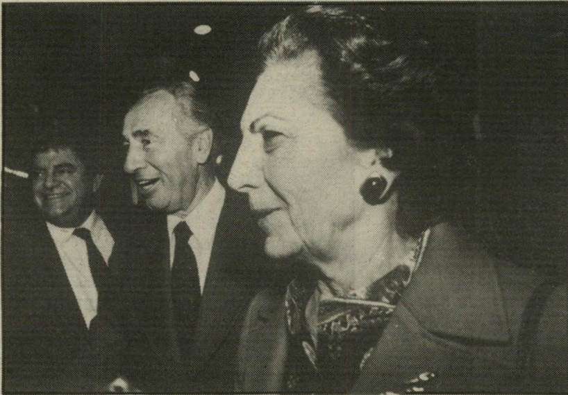
בהופעות ציבוריות נדירות ביותר עם שימעון פרס: 1973 ו-1985

גם כיום משתדל פרס לחזור בצהריים הביתה, לאכול עם אשתו. לפעמים הוא מזמין את אחד השרים, בדרך כלל לצורך "פיוס ופישור". אחרי הארוחה הוא משתדל לישון שעה, לפני שובו למישרד. הוא נמצא בבית בין 1 ל-4 אחרי-הצהריים, חוץ מאשר בימים של ישיבות-הממשלה וסיוורים ברחבי הארץ. בתקופה הראשונה של כהונתו כראש-הממשלה נהג לנסוע כסופי-שבוע לדירתו בתל-אביב, בשיכון המהודר שנבנה על-ידי