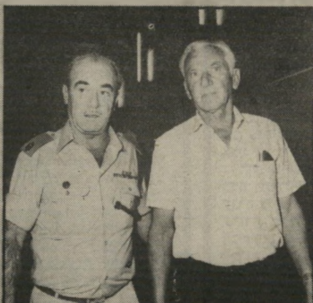
שרי-המישטרה ברלב ומפסל קראוס אכזבה

לא ברור אם היה זה מיקרי או מכוון — אך באותו היום שבו הובאו לבית-המישפט המחוזי בתל-אביב ארבעת האסירים מאגף. רקפת, הגיע לבית-המישפט גם שרי-המישטרה חיים בר-לב ופמלייתו. שורה שלמה של מושבים נשמרה עבור השר. המפסל, מפקד מחוז תל-אביב ועוד קצוני-מיש-טרה בכירים, באולם שבו התקיים מישפטן של שרה אנג'ל ותיקי ארביב. אך המישפט הסתיים בהפתעה יותר מוקדם מהצפוי, והשר לא הספיק להגיע. השר חשב לבקר גם במישפט-רצח. שנדון באותו היום בבית-המישפט המחוזי, אך גם מישפט זה הסתיים מוקדם. על כן ביקר השר את נשיאת בית-המישפט, השופטת חנה אבנור, והלך להאזין למעצרים בבית-המישפט השלום.