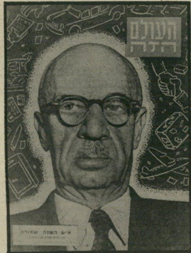
אישה השנה תשי"ב מבקר-הסוכנות שמוראק