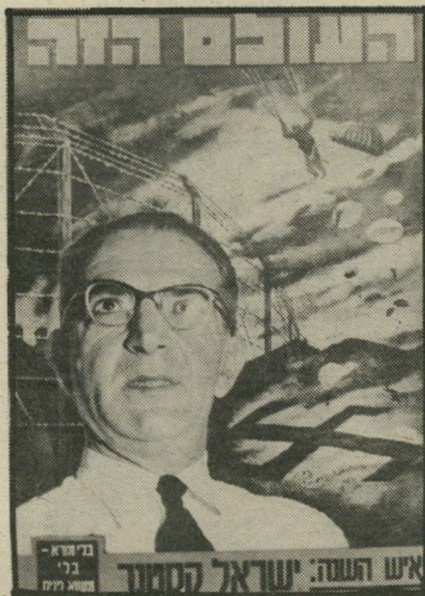
אישה השנה תשי"ד עסקן-שואה קסטנר