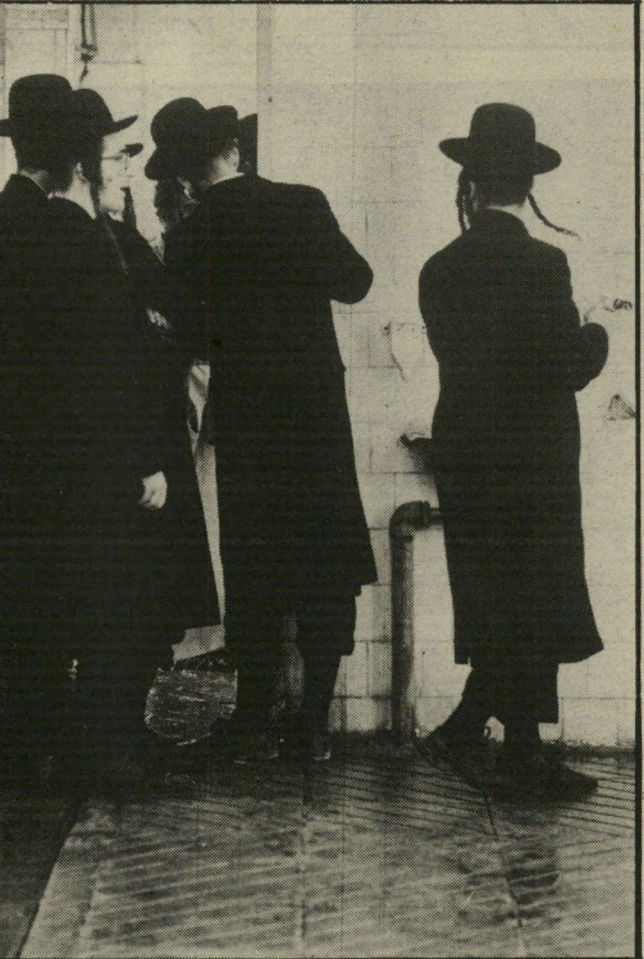
המציצים: אבנכים המבקשים לרכוש מיקצוע

הפולמוס הבריטי אינו חדש. מזה 400 שנים מתנהל כרהבי העולם ויכוח מר ונוקב לגבי מידת רחמנותה של השחיטה היהודית. לעיתים יש בוויכוח