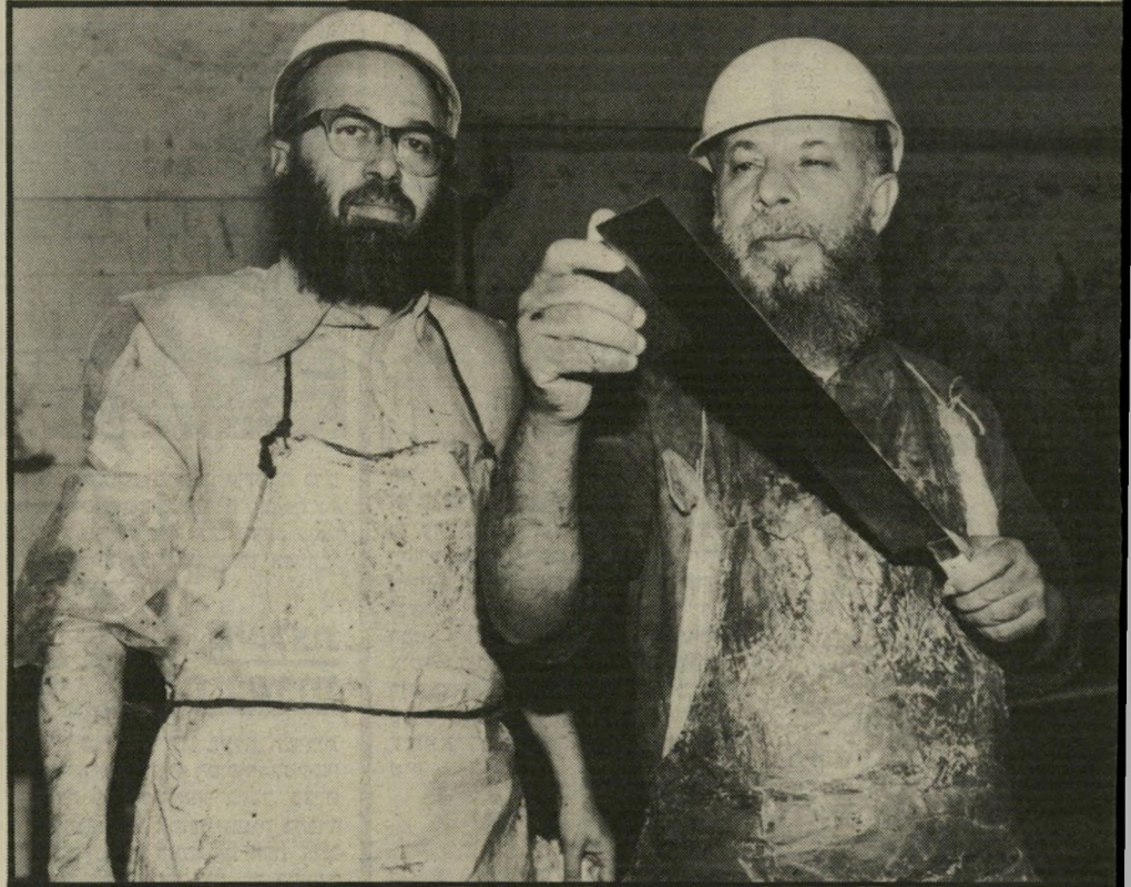
על הסכין: חדות הסכין נבדקה 12 פעמים באצבעותיו של השוחט

ראגה כנה לבעלי-החיים. לעיתים מתלווה אליו נימה אנטי-שמית. רבות מאגודות צער בעלי-החיים אינן אלא אירגונים אנטי-שמיים. במסווה של רחמים הם מבקשים לערער את לבליבו של אורח-החיים היהודי-רתי. כך, למשל, נאסרה השחיטה הכשרה בארצות הכיבוש הנאצי.