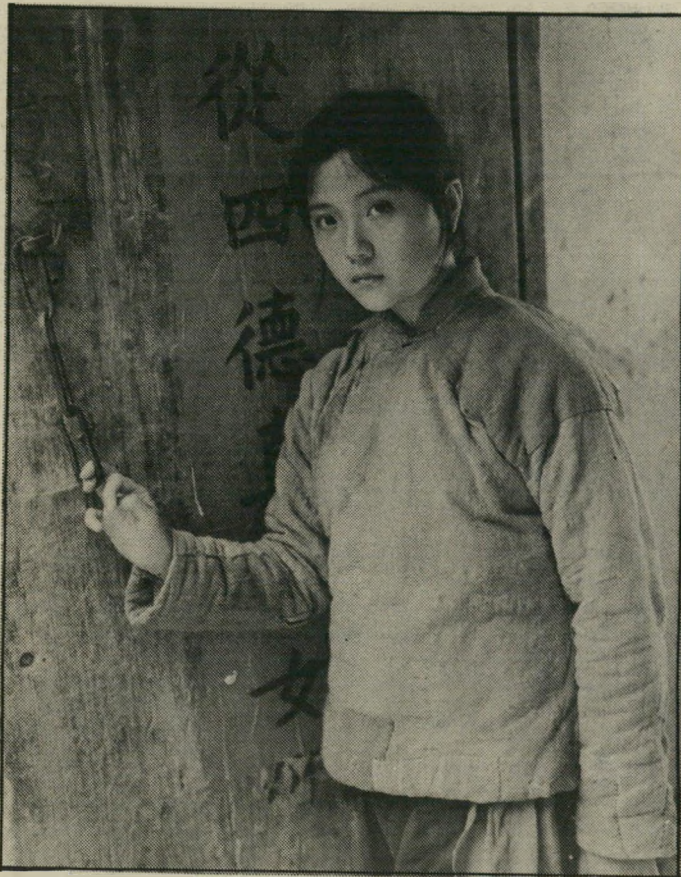
סרט סיני המספר על חיי העוני והרעב ועל מינהגי-פולחן קדומים בסין שלפני מילחמת-העולם השנייה, אדמה צהובה, זיכה את יוצרו בפרס השני של פסטיבל לוקארנו, ברדלס-הכסף.