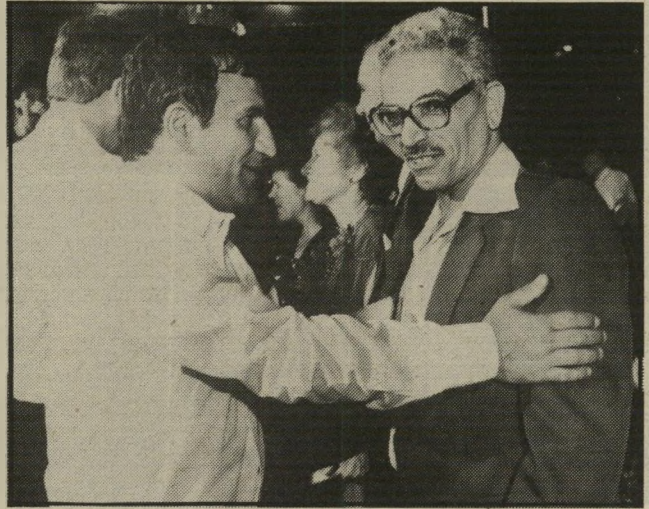
מוזכיל קיסר ובנקאי צדיק מי הציע מה?

בדיקת העולם הזה העלתה, שאם אכן היה קשר כלשהו, לא יותר