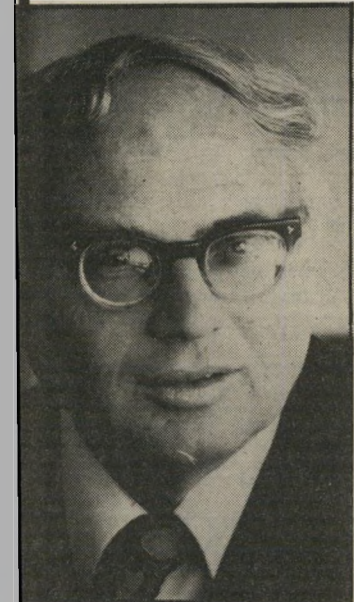
השופט שטרומן -

עבירה לקיים יחסי-מין עם אשה בוגרת, מרצונה.“ אחרי מלים בוטות אלה שיחרר השופט שטרומן את אמיצי, בסכום הפעוט של 100 אלף שקל. בערבות. אמיצי חזר הביתה לאשה, לילדה ולעסקים.