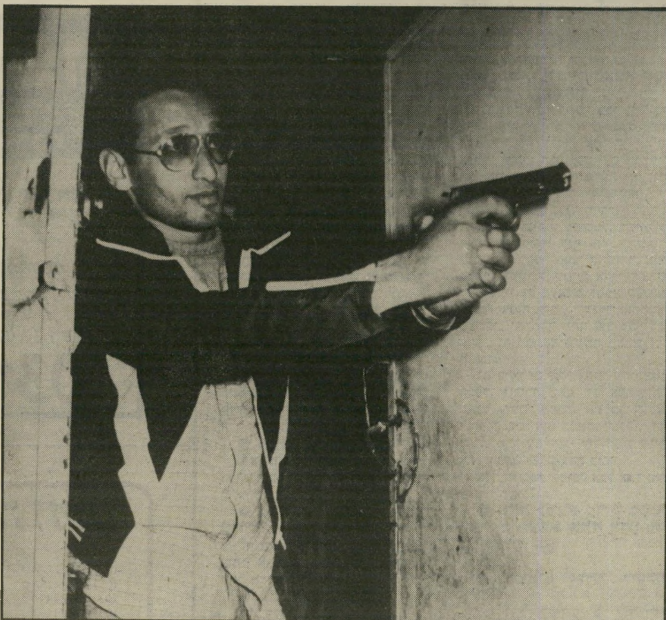
אסיר משהראזוי (בתמונת שיחזור של העולם הזה) חנינה בזכות העבר

נחום. אינני רוצה להכפיש איש במדור זה, אלא רק לעזור לאסירים במצוקה. מישפחתו, הרוצים להשתמש בשרותיו.