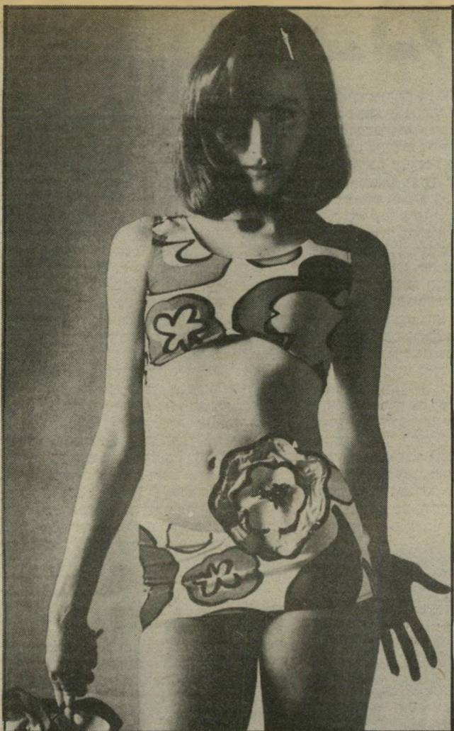
לא מוגדר נראה במבט ראשון כמו בגדיים. אבל זה בגד ליציאה אה - לנועזות בלבד. החולצה קצצורה, הדוקה והצאית מיני. מתחתיה אפשר ללבוש בגדיים. הבד מירחוני וציבעוני.

זרים המוסיפים, משנים, מגוונים ומחדשים את הבגד. הם הם ההופכים את ההופעה הכי ללית לאופנתית ביותר. רוגמה? שימלת-טריקו בת שלוש או ארבע שנים, פשוטה וחלקה, ממש לא מרשימה — ליכשי אותה ונעלי סנדלים אורייגילים עשויים רצועות עור דקיקות בגוון טורקוז, עליהן מודבקות אבנים ציבעוניות. ירוקות, ורודות וסגולות.