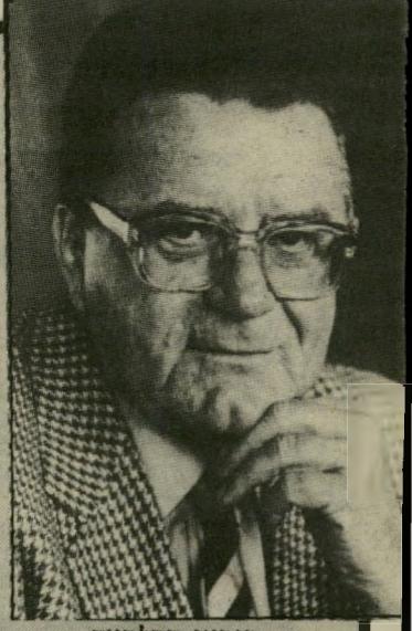
בנקאי הסלכאך יד רוחצת יד

זה זמן-מה מוועזת המערכת הפוליטית הגרמנית על-ידי גילר יים מדהימים על כספי-שחוח אדירים. ששולמו על-ידי איליהון גרמניים למיפלגות הימין והמרכז בגרמניה. חברות-ענק גרמניות, כך הסתבר, נתנו לשחד באופן שיטתי פוליטיקאים ומיפלגות, עכשיו הגיעה החקירה גם אל המיפלגה הסוציאלי-דמוקרטית הי-גרמנית. לעיני החוקרים התגלתה תמונה של שחיתות מיפלגתית. איש-הכספים של מיפלגת-העבודה הגרמנית — ש היתה במשך תקופה ארוכה מיפלגת-השילטון — היה גובה סכומי-ענק ממיליונרים שונים. אלה היו מוכנים להעביר סכומי-שחוח אלה כתרומה למיפלגה, בתנאי אחד: שיוכלו לנכות את הסכומים מן הרווחים שלהם, החייבים במס. לצד המיפלגה קיימת קרן, הקרויה על שם אחד מגדולי המיפלגה בעבר, קרן פרידריך אברט. וזהו קרן למטרות חינוכיות ותרבותיות, שמונת לנכות את התרומות לה ממס (כמו התרומות למגבית היהודית המאוחדת באמריקה, בגלל פעולותיה בשירות הציבור). לעומת זאת אסור בהחלט לנכות ממס את התרומות למיפלגה. על פי החשד, שהתגלה השבוע