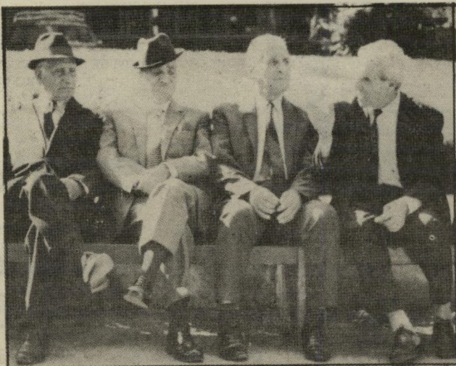
תלמידי בית-הספר ממתינים לקבלת הבגרות