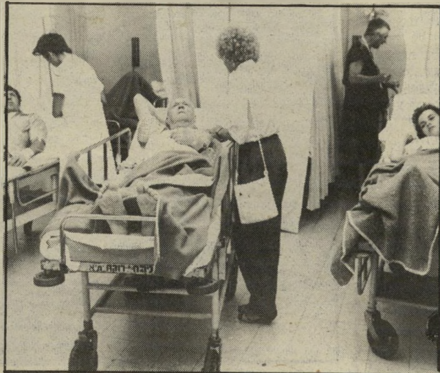
חולים מפגינים בעד הפיטורים