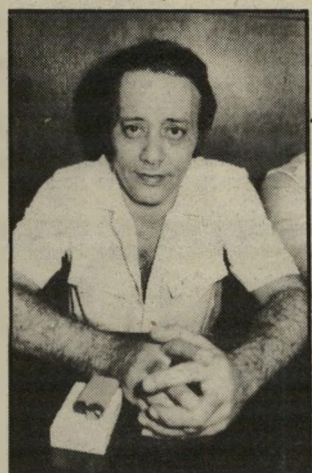
רחמים אהרונים געגועים רווי-נוסטלגיה

בהחלט שירש הבאבא-סאלי מנתיבות, ברוך אבוחצירא, ישוב אליה בקרוב. ומירה היא אשה מאמינה: לא לחינם היא מחזיקה במכוניתה גם את תפילת הדרך וגם את תמונתו של הבאבא סאלי, אביו הגדול של ברוך אבוחצירא.