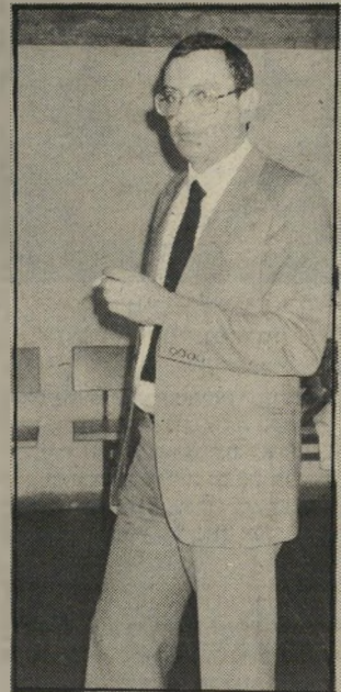
פרקליט חלד שלוש דירות, שתי מכוניות וריבית

בשנים אלה גם רכש אבוחצ'ירא למען מירה שתי מכוניות, כזו אחר זו. כאשר הצ'יטוראן בת השנה, שעלתה 7,500 דולר, לא נאיתה עוד למירה, הוא הוסיף עוד 7,000, וכך היתה למירה בסוף 1981 צ'יטוראן חדשה, מדגם '82.