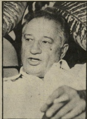
יהלומן שניצר קצר בתיקשות

מה לא נכתב על הסוירים המאורי גנים לעיתונאים. הנוצרים על חשבון הגוף הממתין אחרי-כך שיתפרסמו עליו כתבות אהרות?