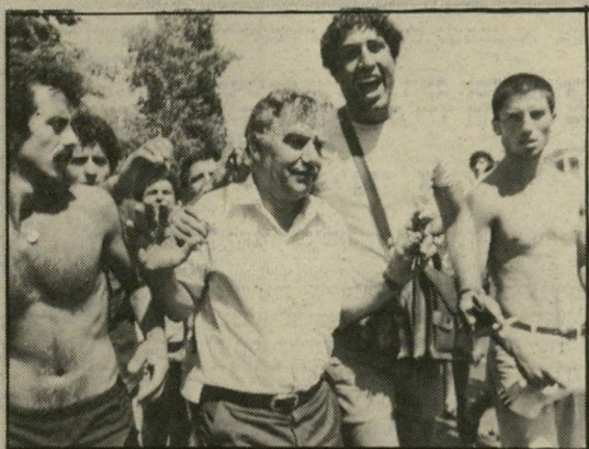
כהן-אבידוב בעפולה שיהיו חמישה מיליון

מורה מינצבריינר , עיתונאית על-המישמר שסיקרה את ההתפרעויות בעפולה, עמדה כאחד הימים בתחנת-המישמר של העיירה ולגמה קפה מתוך תרומם. לפתע הבחינה בפנים מוכרות. סיפורה העיתונאית השבוע: יגש אלינו ח"כ מאיר כהן-אבידוב ואמר: סליחה, אולי אני יכול לקבל ממך לגימת קפה? קולו היה שקט וצורר, אחרי שזעק בכיכר מוות למחבלים! גירוש למייד אבנים ואחרי שהחליף צעקות רמות עם קצינים במישמר, בדרישה לשחרר את נהגו, שנעצר במהלך ההתקהלות. אמרתי: בבקשה, ואולי אדוני גם ייסע לביתו ויקבל את השבת? היה זה דהף פיתאומי, שנבע מרצון מבוהל להכניס את כולם לבתיהם ולהחזיר לרחובות את השקט. ח"כ כהן-אבידוב לקח ממני את כוסי-הקפה, הביט בי ושאל לשמי ולעבודתי. אמרתי שאגיד רק בתנאי שלא יכעס עליי ולא יצעק. הוא הבטיח, ואני הסגתי את שם העיתון ואת שמי. ואז, לא להאמין, הוא אמר, בטון מתלהב ממש, את הדברים המפורשים הבאים: למה את מתייחסת אליי בדעה קדומה? את על המישמר אני קורא כל יום. ואומר לך משהו — לוא היו לנו בארץ עוד חמישה מיליון יהודים כמו יוסי שריר, כל הבעיות שלנו היו נפתרות! חשבתי שאני לא שומעת, אבל הוא חזר על המישפט. אם ואת דעתך, אמרתי לו, אולי תחזור לרחוב, תטפס על מכונית-הגלירה, תאמר שם את דעתך ותרגיע את הקהל הצורח מוות לשמאלנים! מוות לעיתונאים! הח"כ סירב, אמר שלום עם ולכבי, שיחרר את נהגו ממעצר ושב לביתו.