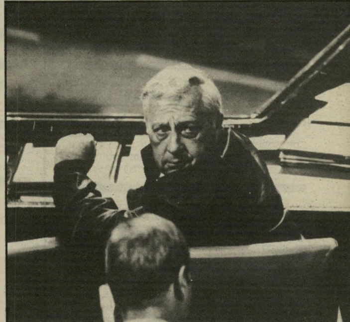
שר שרון הספירה לאחור החלה

חמורה הרבה יותר היתה פרשת עפולה. גם במיקרה זה היו התיאורים הראשונים עשויים להביא להתלקחות גדולה של יצרינקם. נאמר כי הרוצ"חיים נטלו נשק ויצאו "להרוג יהודים". השבוע התגברה גירסה אחרת. הצ"עירים הערביים, כך הסתבר, הפתיעו את הווג, שהתבודד במקום נידח בחור"ש. שה הגבר התרגז, יצא ממכוניתו, איים על הנערים, וכנראה ממטיר עליהם גם קללות. הצעירים, שלא היו חמושים, נפגעו בכבודם, חזרו הביתה, לקחו נשק, חזרו למקום והרגו את בני-הווג. גם כך זהו פשע נתעם — אך הוא