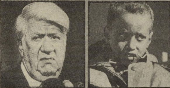
סוכן ה"קא-גיה"ב האתיופי (מימין) לפני הטבילה ואחריה

דוח סודי, שהודלף לידי עורכי העולם הבא, חושף פרשה מסעירה, שאירעה לפני חמישה חודשים. ראשית המעשה היתה כאשר אתיומי צנום ושיכור טבל בטעות במימי המזרקה שבכיכר מלכי-ישראל בתל-אביב, ומשנתעשת