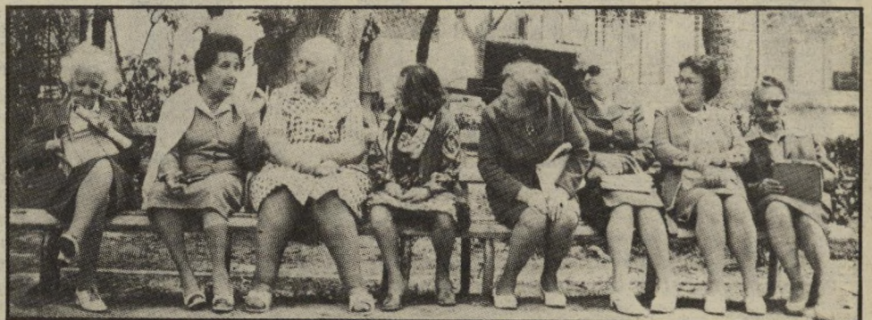
מורות מפוטרות ממתינות ללקוחות

בהפגנת זונות מול מושב הכנסת, מחו הווינות על איומי מורות מפוטרות לרדת לזנות. זוהי תחרות לא הוגנת, מסרה לכתבנו.