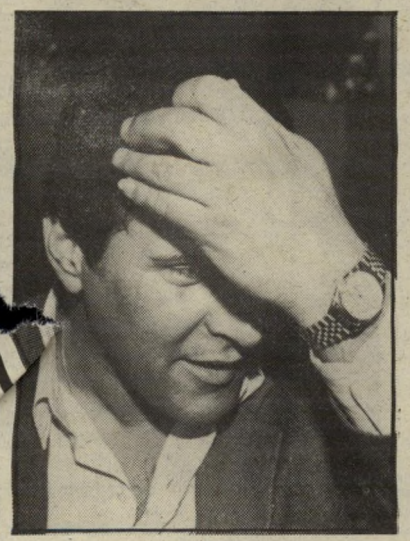
קבלן אפל משנה שם. משנה מקום

ציניקים טוענים, שיעקבי בחר במיקום המישרד לא במקרה, אלא משום קירבתו למיזנון בית-העיתונאים. בממשלה הוא מנוטרל, ואומרים עליו שהוא גמר את הסוס במפילגת העבודה. אולי רק תיקשורת טובה ואינטנסיבית עור עשויה להציל אותו?