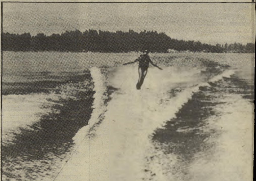
דני עושה סקי הים היה ההובי שלו. וביום הוא מצא את מותו. הגבר הנאה, הספורטיבי וגבה-הקומה (1.85)

ההילוכים הפוכות. כשאתה מושך אליך, המטוס עולה למעלה. בסירה צריך להזיז קדימה. שמעתי שטייסים טועים גם בנהיגה על הכביש. "אני לא יודע אם תהיה תלונה נגדו. ידוע לי רק שהמישטרה לקחה את הסירה לבדיקה, והיא חוקרת את המיקרה."