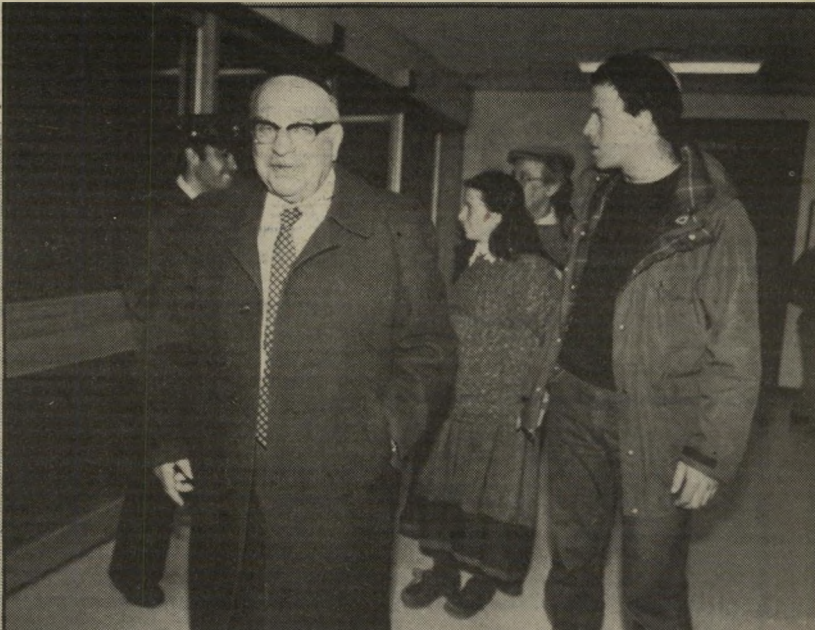
בורג הבן והאב אדם צעיר צריך להיות נגד המימסד!

● היא לא הויקה לך? לא. זה היה לזכותו. אין כזה אסון, אין זו סיבה להשתיק מישהו. סטיבנסון אמר: „הרעש המתוק של הדמוקרטיה” היום במדינה יש הרבה רעש ואין הרבה מותק. ● מפריע לך שהוא אינו חבר במפלגה דתית? הייתי מעדיף שיהיה אצלנו. ● יש לכם ירכחים איריאולוגיים ופוליטיים בבית? לא. יש לנו הרבה ערכים משותפים, וההירדגום שלהם הוא ריעות שונות. אין לנו ירכחים. יש לנו הרבה משותף.