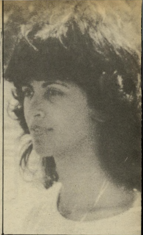
שבוע עלידי מישטרת עפולה, בעת שמאות אנשים חיפשו אחרי שני הנעדרים. אלמקייס בת ה-19, מורה דתית בשירות לאומי, לימדה באותו בית-הספר.