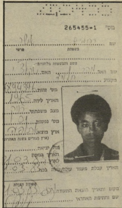
תעודת העולה של רחמים לא לאום, לא דת

אנשים לא מבינים אותנו. בלי שום ספק, לא היה כדאי להם לדבר על העניין של הטבילה. אני משתגע כשאני שומע את הדבר הזה. ליהודי