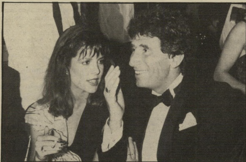
שר לאנג וידידה (קארולין ממונאקו) הצרפתים הענישו את ההונגרים

במקור זו נועדה להיות הפקה משותפת בין צרפת והונגריה. מצד אחד, לאנג ראה ביאנצ'ו את אחד היוצרים המהוללים שהממשלה הצרפתית חייבת לעודד את יצירתו, ללא קשר