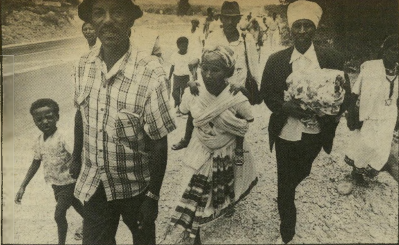
הסגנת האתיופים נגד הטבילה

בתור יהודי שאוהב את ארץ-אבותיו ושיש לו תיקווה, וכל לילה חולם, היה לי קל לקום ולרוץ ולעלות לארץ. אני לא היהודי היחיד שנמצא בגולה, ושכל מה שהוא חושב זה איך לעלות לארץ-ישראל. ירושלים נחשבת לפלנטה מיוחדת. שלא קשורה בעולם כולו. יחידה במינה. כיום שמוצאים פתח, לא בורחים דרך ולא שואלים — העיקר שאפשר להגיע. קמים ורצים. אז גם אני קמתי ורצתי. עברתי שם תקופה במבונאות כדי לחסוך כסף לעליה. כשהגעתי לארץ, אני זוכר שבכיתי ואכלתי עפר. כל מה שהיה — הרמתי ואכלתי. ואמרתי שזה הקודש. ראיתי, הנה, זה החלום. יותר מאוחר באו רבנים שלא חלמנו עליהם. אחריכן, פיתאום שינו לי את השם. אמא שלי קראה לי צגאו, שפירושו תיקווה. אושר. אחרי יומיים או שלושה הרביקו לי שם, וכל בוקר היו קוראים "משה", ואני הייתי צריך לרדת שנה אני. זה הפריע לי מאוד. למה לדרוקמן משאירים את