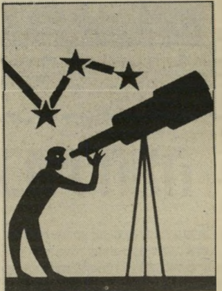
אזרח צופה במדד יולי

מרד יוני — 14.9% מרד יולי — 33.4% מרד אוגוסט — 4.5% תומכים במדיניות הכלכלית של הממשלה.