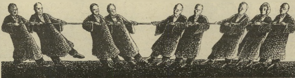
מערכת העולם הבא מתאמנת במשיכת יתר

המערכת עדיין מתאמנת בהכנת בדיחות על המכביה, אם כי סביר להניח שהישגי הספורטאים יחסכו מאיתנו את המאמץ.