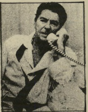
רגן מקבל דיווח על הגידול

מאת קישקע מיט-צ'ולנט ביום השבת הסבה מישפחת ל- טרשפרץ לארוחת-צהריים. שכל- לה מעיים ממולאים וגעפילטע פיש. כאשר לפתע גילה האב גידול סרטני (שרימפס בלעז) בתוך