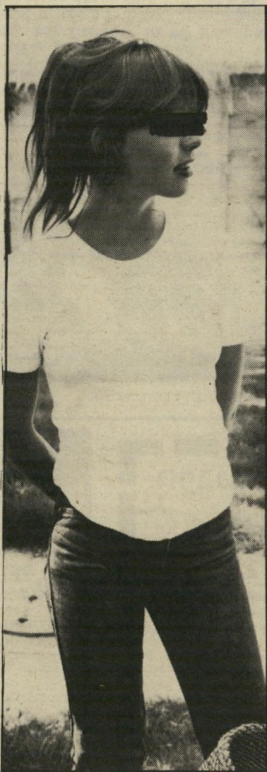
הקטינה שוטרים עם עיני-כלב

החליט מי שהחליט, ואני לא יודעת מי זה היה, שהקטינה תיסע לבית-המישפט כשהיא קשורה באויקים לסוחרת, כדי שלשום שוטר ישראלי לא תהיה הזרמנות להיות איתה לבר אפילו לרגע קטן אחד. מישוה, שראה כמה שוטרים מסתכלים בקטינה בעיני-כלב אוהבות, הציע שהקטינה תבלה את מאסרה דווקא במטה הארצי, כדי לגרוע שם את גזע-האלימות, שהיכה שורשים ארוכים ועזים במישטררה.