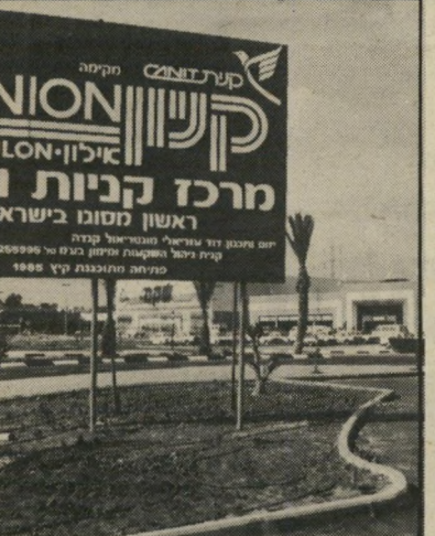
שלט החברה בכניסה לסרוויקט סיכסוך כספי

כאילו לא חסרות צרות לראש עיריית רמת-גן אורי עבדתי , שמו הגיע באחרונה לשולחנו של מבקר-המדינה יצחק טוניק , בעיקבות תלונה שהוגשה על-ידי מנחם גילעד , חבר מועצת העירייה מטעם הליברלים ויושב-ראש ועדת-הביקורת העירונית. הסיבה: גמר החשכון בין העירייה ובין חברת קניית של המיליונר היהודי מקנדה דויד עזריאלי , שכנתה והמפעילה את קניון אילון, מרכז הקניות הענק שליך איצטריון רמת-גן, שנפתח בתחילת החודש. כתוצאה מהסכם מסוכן, שנחתם עוד בימי כהונתו של ראש-העירייה הקודם, ה"ר ישראל סלר , איש הליכוד, נוצרה אי-הסכמה בין הצדדים סביב השאלה מי ישקיע עבור הפיתוח ועבור שיפוץ איצטריון רמת-גן. נשאל גם מה יהיה גובה ההכנסה של העירייה כתוצאה משינוי תוכנית המיתאר ליעוד הקרקע. העלויות של עבודת-