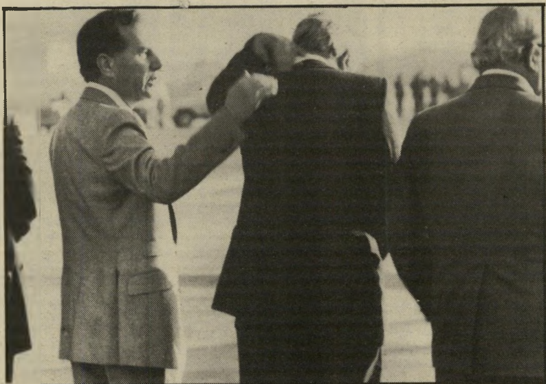
שרים נבון (מימין) ורובנישטיין (משמאל) טלוויזיה בתשלום:

מתנגדי פורת אומרים שהוא התייצב אצל יצחק שמיר והבטיח לו להיות בסדר ולחזור לחיק הליכוד. תומכיו יכולים שוב להרים את הראש בגאוה.