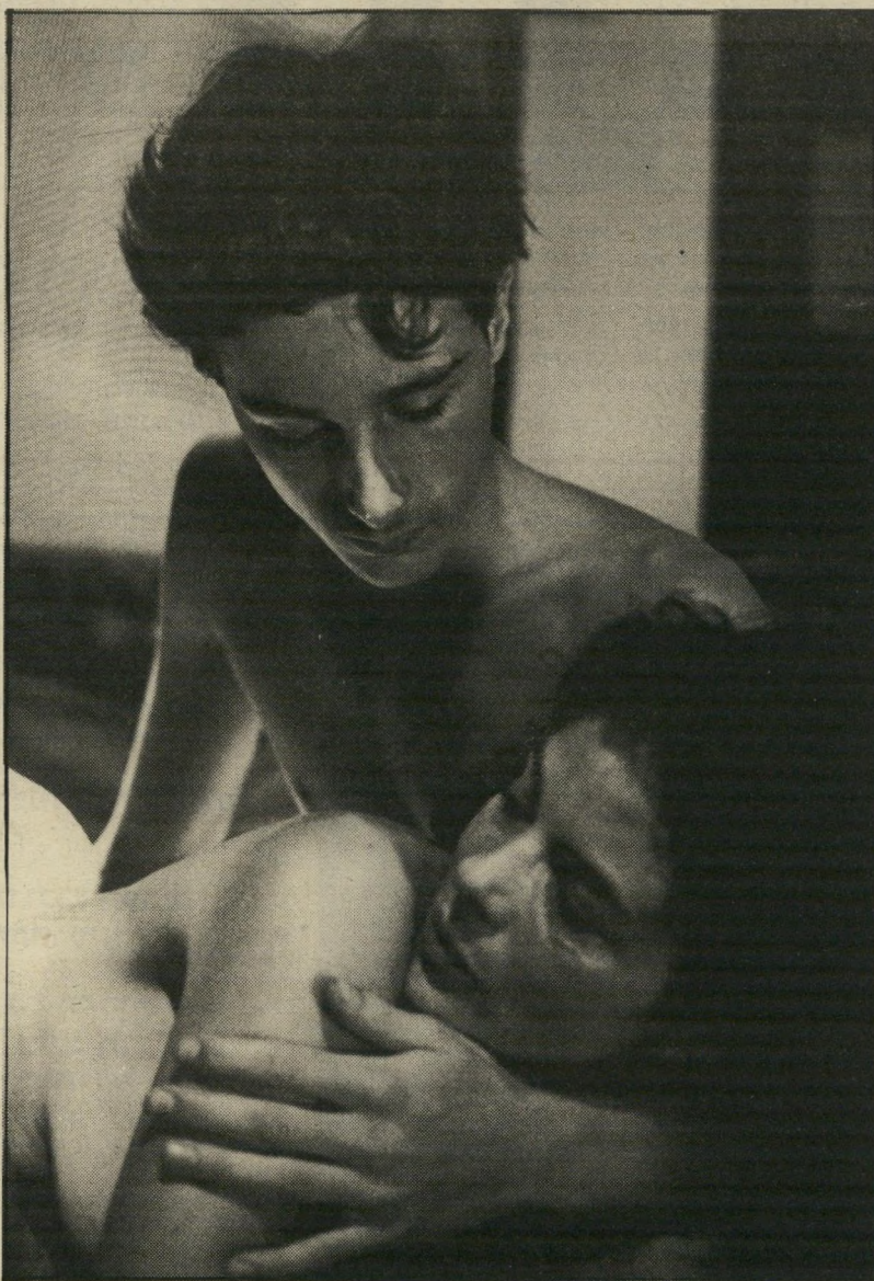
גודרון לנדגרבה וזרג ריכטר בהיימאט כפר קטן בגרמניה

בל חיפה (ה-30 בספטמבר עד השלושה באוקטובר 1985) היא הצגת סרטי-הטלוויזיה היימאט. בואו של הבימאי, ארגר רייס, עדיין מוטל בספק. גם אם לא יהיה שום דבר אחר בפסטיבל-חיפה מלבד האיימאט, הרי שכבר מובטח מילויין של שעות-ההקרנה במשך יומיים מתוך שלושה וחצי ימי-האירוע. שכן, סידרה טלוויזיונית יוצאת-דופן זו מורכבת מ-11 חלקים, ובסך הכל אורכה 15 שעות ו-40 דקות.