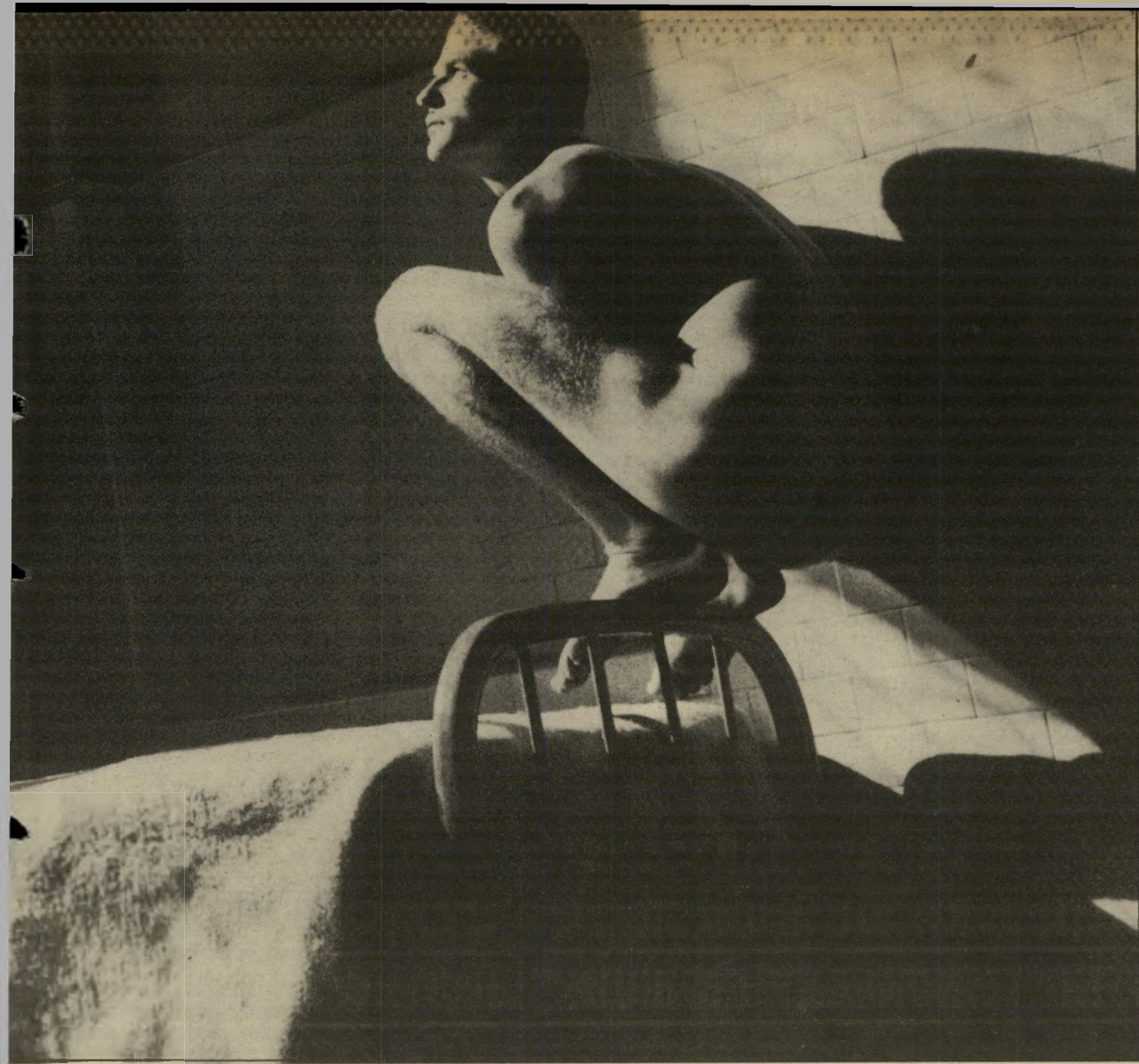
מאתיו מודין בגיבור הסרט, בירד' של הבימאי אלן סארקך שיווי-מישקל גופני, נפשי ורוחני

ב שנה קולנועית משמיה, שרוב סרטיה תאומים, הבקיעו שני אפרוחים את ביצתם והצמיחו כנפיים חזקות. הם למדו לעוף כל אחד בתורו וכל אחד בסיגנונו, אך כשנפגשו יחד בבירד' (פרס מיוחד של פסטיבל קאן '85) לא היה ספק בענייניו: מאתיו מודין וניקולאס קייג', כל אחד בן עשרים ומשהו, יהיו יורשיהם של רוברט דהנירו וג'ק ניקולסון. העיתונות המריחה תגליות, מרימה את שני האפרוחים מעפר האלמוניות, מאלפת אותם, מעייפת אותם, מתרפקת עליהם ולעיתים גם מפילה אותם לקרקע בנחיתת-אונס. התימוזן לפגישתי עם מודין וקייג' היה, על כן, באחד מאותם רגעי-חסר אופוריים, שלא יישכחו לעולם