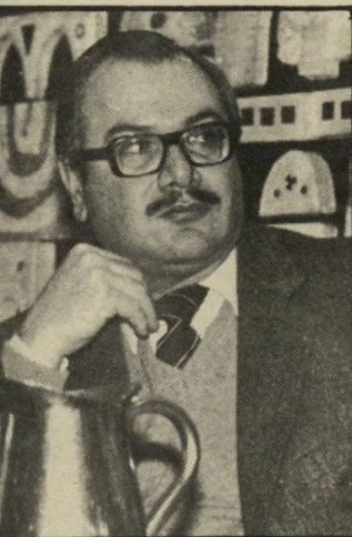
מועמד סניורה לא זבוב מול פיל

ואת המוני העם הפלסטיני לעלות על דרך פרגמטית של שיחות-שלום, הם מוכרחים עכשיו להוכיח כי דרך זו מובילה להישגים כלשהם. ואם לא להסכמת ישראל להידבר עם אש"ף, הרי לפחות לצעדים אמריקאיים כאותו כיוון.