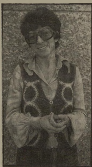
עיתונאית הרשימי איזה נס! איזה נס!

הדבר העקרוני, שאין לשכוח אותו. הוא שהכוונה היתה להש-איר אותו במעצר עד הבוקר. ללא שום סיבה או חקירה. כלומר — המעצרים והמכות הפכו לאמי-צע-יעוניה בידי שוטרים. לולא ההתערבות שלנו. אין לדעת איך זה היה נגמר.