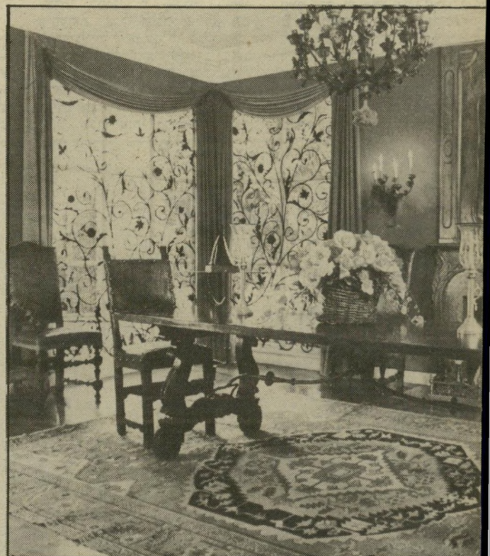
חדר האוכל גדוש העתיקות, כפי שהוא מופיע בירחון הניקו רה האמריקאי, ארכיטקטורל דיגסט. שהקדיש שמונה עמודים מרובי תצלומי צבע מרהיבים לוויילת-הפאר של מהטה.

שנתיים. אני די נבוך כשאת שואלת אותי על הנשים המוזרות אחריי בארץ. האמת היא שבעולם-המוסיקה יש כל כך הרבה פייגלאך (הומנו-סקטור אלים), שאם יש כמה נורמלים, למה שהם לא ייהנו? שיהיה להם לבריאות.