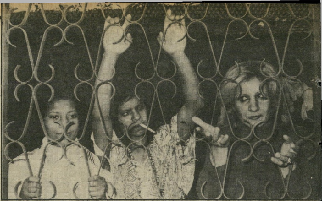
לתוך המעון. הפגישות הן ליד הגדר. כאשר מציבים כסאות לידה, או בבתי-קפה סמוכים. אף אחת מהנשים המצולמות בתמונה איננה נזכרת בכנתה.

אותי בפני העובדה שאם אעזוב ואקבל עוד פעם מכות, לא אוכל לחזור למעון בהרצליה.