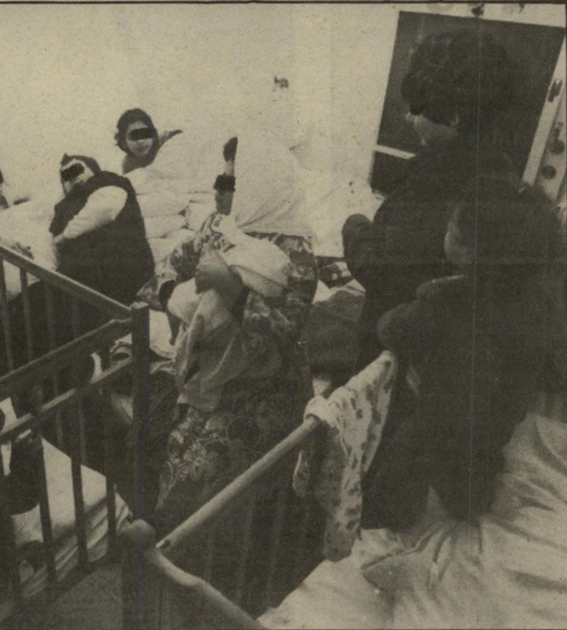
לגור במעון רק כדי שתוכל להיפגש בקלות עם מאהבים. תנאי-הדיור במעון לנשים מוכות קשים מאוד ויש נשים הישנות על מיזרונים על הריצפה.

מיטה ומצעים. ביום הראשון, כשבאים למעון, לא עושים תורנויות, אבל כבר למחרת משכבת אותך האחראית לתורנויות. יש תורנות-נקיון ויש תורנות-מיטבח ויש תורנות-קניון. זה יוצא לכל אחת בערך שעה עבודה ליום. בדרך-כלל יש במעון כשבע נשים על ילדיהן. בפעם שעברה הייתי בחורף ולא יצאו כל-כך הרבה, אבל הפעם ממש חגגו במעון. אף אחת לא הלכה לישון לפני 2.