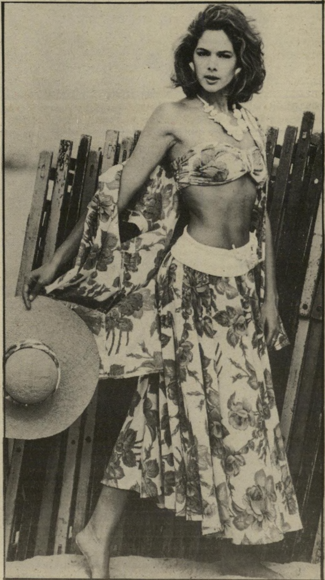
סיגנון הוואי חולצת-חזיה קיצית וחצאית-קלוש ארוכה בהדפס פירחוני. אימרת החצאית אלסטית, כך שאפשר להורידה מן הטבור. משמאל: חולצת-טריקו עם צווארון-סירה.

לחושפות-הכתפיים עיצב רפי יעי קבזון שמלות-סטרפס, כשימלת-עור בגיורה צרה או כשימלה עשויה בר בסיגנון מרילין מונרו. ללבישת שמי לות אלה ררוש גוף חטוב וכתפיים לא כליכך רחבות.