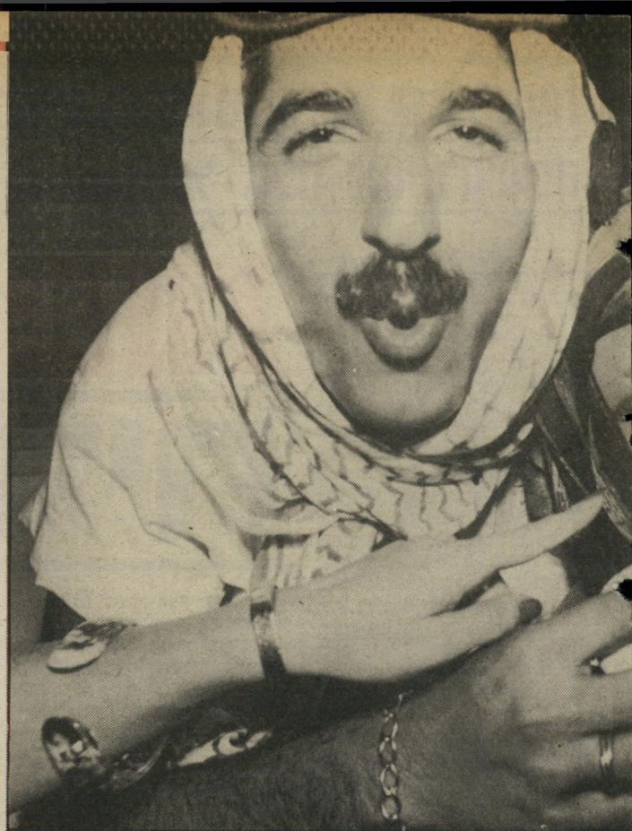
את מיסעדת לצד בובה, שהוצבה בתוך אוהל בדווי, אשר הוקם נכנס לאווירה במיוחד לפתיחה. בהמשך הופיעה לפני החוגגים רקדנית־הצטלם דווקא בטן, שטבורה החשוף משך עשרות סקרנים מהרחוב.