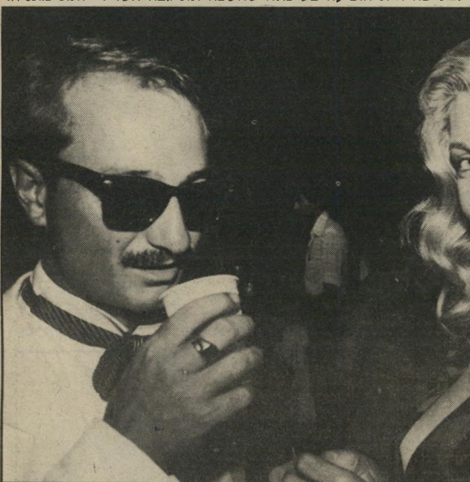
המגלמת בסרט־הפעולה את דמותה של ונה, השליטה־הלוחמת של גזע אמאזונות עתידי. למסיבה היא הופיעה בשימלה שחשפה את גבה השרירי ואת מתניה.