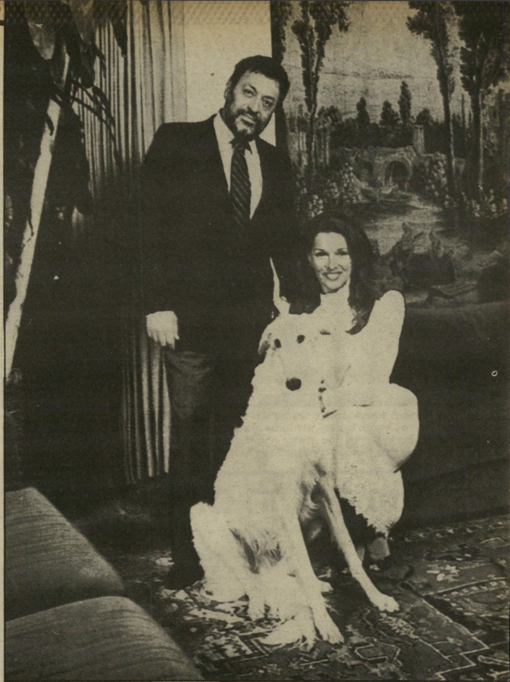
לבקר בוויילת-הפאר שלהם לעיתים קרובות ככל ה" אפשר, אפילו כשהשהייה שלהם בה מסתכמת לפעם- מים ביממה: "זה המיקלט שלנו מלחץ ההופעות."