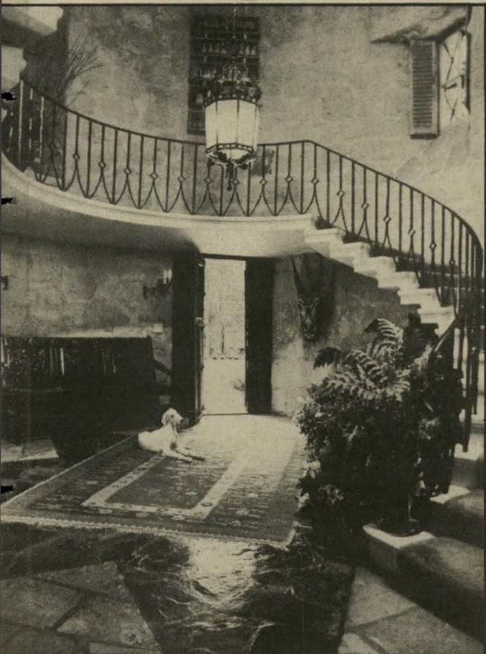
אולם הכניסה של הווילה גדוש אוצרות רבים. שבני-הזוג דלת-הכניסה, המגולפת בעץ, היא מציאה איטלקית מן המאה ה-18.