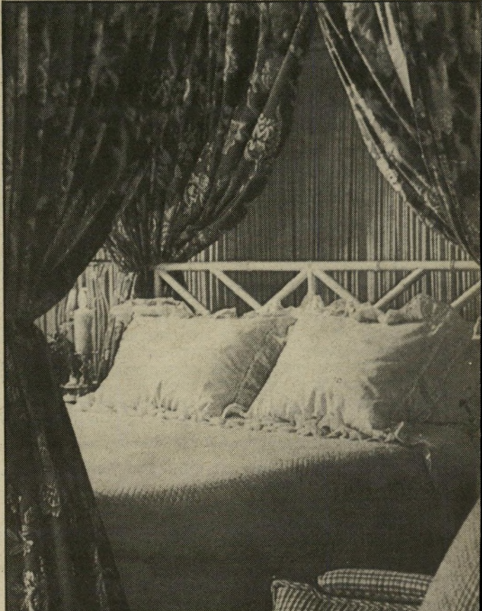
חדר-מיטות לדעת נאנסי יש לכיסויי-המיטה ולווילונות ששביבה מראה מיזרחי. זובין גם מכנה את הוויי" לה "חאן" — שהוא, כפי שמזכיר המנצח, המיקלט המיזרחי לעוברי-אורח.

כשאני עובד בחוץ, אני רורש שישלמו לי כערכי. אם לא משלמים לך, אתה גם לא שווה. אבל ברגע