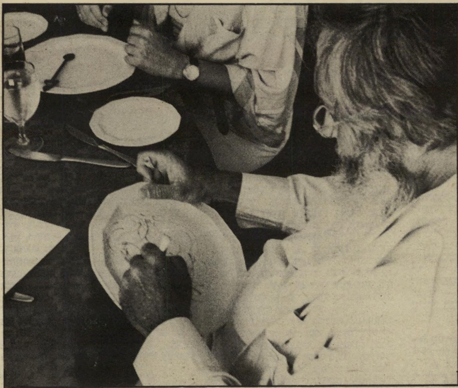
עקב אגם האמן המפורסם בא לסעוד את ליבו במיסעדה תל-אביבית. בחברת ידידה. לאור המיבחר הקולינארי, העדיף אגם להתרכז בצלחות שעל שולחנו. הוא נטל צלחת וצייר עליה את דיוקנה של חברתו לארוחה, שהעלה את ערכה של הצלחת לסכום בן ארבע ספרות (בדולארים). משביקש המיסעדר לקנות את היצירה, צחק אגם: „באתי לקנות ארוחה. לא מיסעדה...”

טיר בכנסת, לצחוקם של עמיתיו: „זה הרבר האחרון שנותר מהמפר”ל” ■ שרהאוצר יצחק מודעי, ניסה להרגים פרט כלשהו בתוכניתו הכלכלית לפני ועדת הכספים של הכנסת. הוא התחיל להרגים זאת בהשתמשו במושגים מתעשיית הבשרים, ולפתע הפסיק ואמר: „טוב, שחיים ימ” שיק”. מודעי הצביע לעבר חברי הוועדה חיים קרמון . השניים התעסקו בתעשיית הבשרים — קרמון כייבואן ומודעי כמכ”ל-