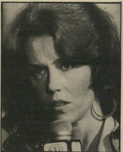
ג'יין פונדה: בשיא המילחמה

הכולל את כל אנשי אש"ף והטיל על מגע כזה עונש חמור. אולם החוק מכיל ערוכות נגד ניצולו לרעה. הוא קובע שלא יורשע איש על עבירה זו, אם יוכיח הנאשם כי קיים את המגע למען מטרה סבירה, וכן שלא התכוון לפגוע בביטחון המדינה ואף לא געז בו בפועל. מוסכם שרדיון על השלום הוא מטרה סבירה.