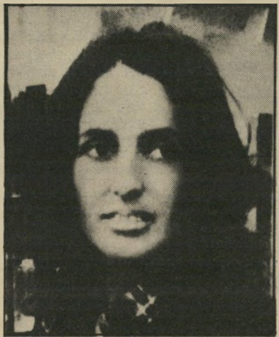
ג'ואן באאז: תחת הפצצות

אש"ף הוא התנועה הלאומית של העם הפלסטיני. 95% של העם הפלסטיני רואים בו את הנהגתם הלאומית. מאוגרים בו גופים ואישים פלסטיניים מכל הסוגים — נציגים יוניים, אנשי פלסטין השלמה" ושוחריה השלום. יש בו מוסד