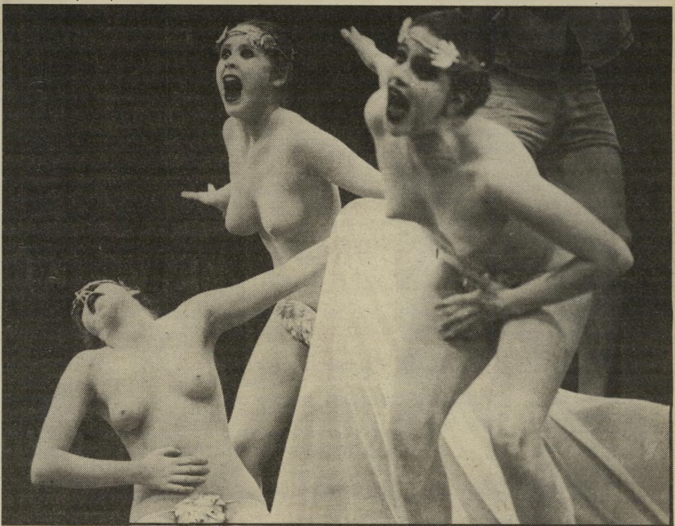
אמהות מרובות-ילדים בהפגנה סוערת נגד התוכנית הכלכלית לפני מישרד האוצר

מישרדי האוצר, בשיתוף צה"ל, יחסלו את מישכנות העוני בשלב הבא של התוכנית הכלכלית. במיסגרת המיבצע נשקלה האפשרות של הפעלת חילי האוויר ויחידות ארטילריה, שיישמו את לקחי מולחמת-הלבנון, אולם מס' תבר שכנראה לא יהיה כל צורך בכך.