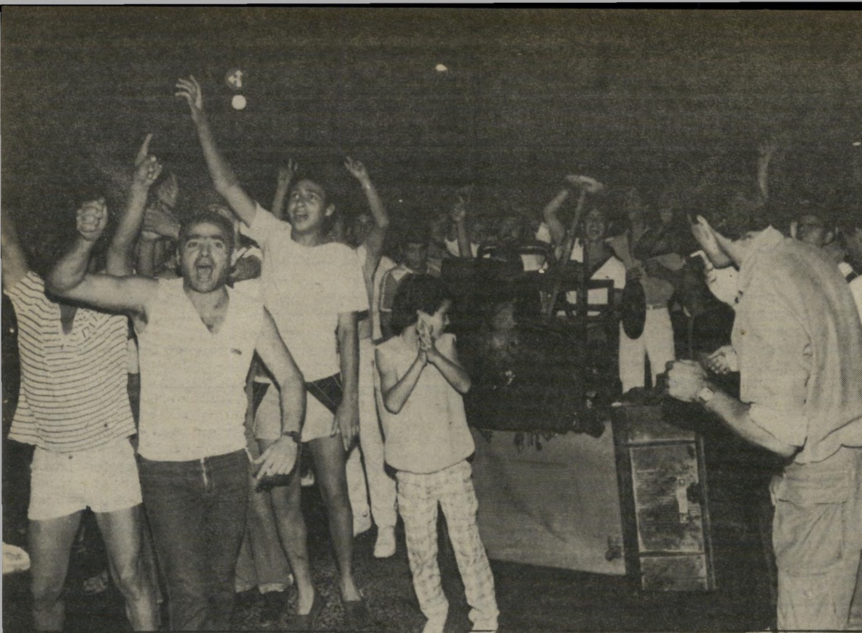
הכנת מדורת-המחאה בקטמון אתם בחרתם בפרס, וזה מה שיצא!

האמיתית. שילמדו ממהאטמה גאנדי בהודו. שעשה מהפכה בלי להרים יד, שילמדו ממרטין לותר קינג, שהצליח בלי אלימות. ● גם אתה בא משכונת מצוקה. כן. הוריי עלו לארץ מלוב. אני נולדתי במעברת תלפיות בירושלים, אחר-כך עברנו לגור בשכונת קטמון ח'. למדתי בבית-ספר המאירי, הייתי תלמיד מצטיין. כשסיימתי את כיתה ח', רציתי להירשם לבית-ספר טוב, אבל אז הסתבר לי שהרמה המצויינת שלי מבית-הספר העממי שווה לרמה של כיתה ח'. ניגשתי לבחינות הכניסה ולא הבנתי מה רוצים ממני, התבלבלתי לגמרי. או הלכתי לבית-ספר בעין-כרם, שהסכים לקבל אותי, וסיימתי אותו, כולל חצי תעודת בגרות. אחרי בית-הספר התגייסתי לצבא. ● זה די נדיר שאנשים מן השכונה הלכו לצבא. בדרך-כלל הגיעו לבת-ספר סוהר.