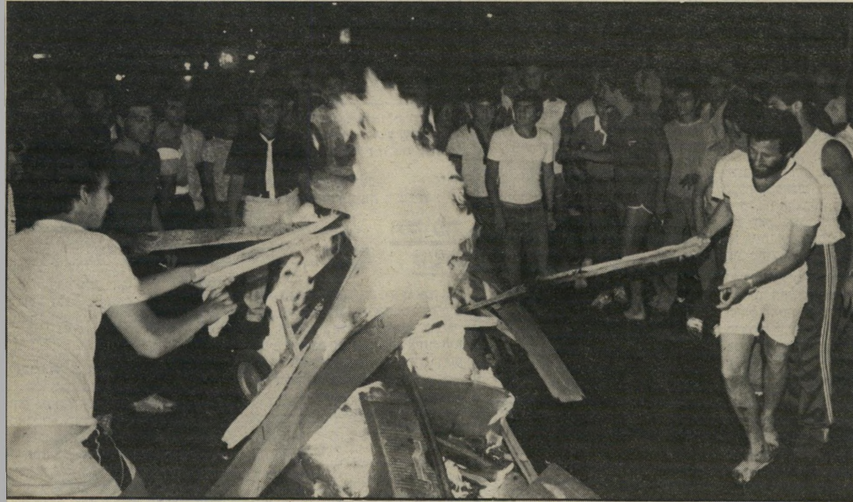
הבערת מדורת-המחאה בקטמון קיוונו שנצליח להדליק הרבה שכונות!

הגענו למצב שהמנהיגות בשכונות הלכה שמאל, אבל העם נשאר בימין. עד היום יש ויכוחים בלילות-שבת במישפחה, אבל לאט-לאט גם אבא שלי משתנה, גם הוא מכין שהליכוד הרס את הכלכלה. אני רוצה להאמין שהמאבק הוא משותף לכולם, לכן הקמנו מטה שהוא אפוליטי וכולם ניוחד פועלים למען אותה המטרה. ● יש כאלה הדוחפים לאלימות? אנחנו פוחדים שעוד מעט לא תהיה שליטה על האנשים, כי אין להם מה להפסיד. ואז נאבד את השליטה בהפגנות והאלימות תפרוץ. ● בעבר השתתפת בהפגנות שהיו כסאה? היו כאלה בנובמבר 1979. אנשים רצו לשרוף תחנת-דלק, אני עמדתי לפנייהם ואמרת: "קודם תשרפו אותי!" והתעלפתי. אז הבנתי שלאנשים האלה אין מה להפסיד, וצריך לעצור את ההמון. ● מה עשית אחרי הצבא? למדתי נמכון להכשרת-מדריכים, סיימתי כמדריך מוסמך עם תעודת-הוראה, ומאז אני מדריך-נוער. ב'1977 הקמנו את תנועת האוהלים והתחלנו לארגן את השכונות. היום אני מנהל את תוכנית הרווחה ושיקום-השכונות באזור גוננים ומנהל את המתנ"ס.