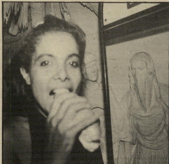
הדוגמנית נגסה בכריך של נקניקיה ב"לחמניה. על חזה המהודר ענדה חדוג' מנית מדליה גדולה ומוכספת. כראוי לחגיגת מעצמה גדולה.