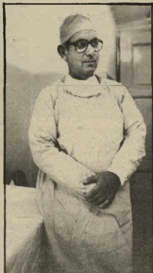
מנהל מוהטבי חולה רוצה טיפול בשפתו