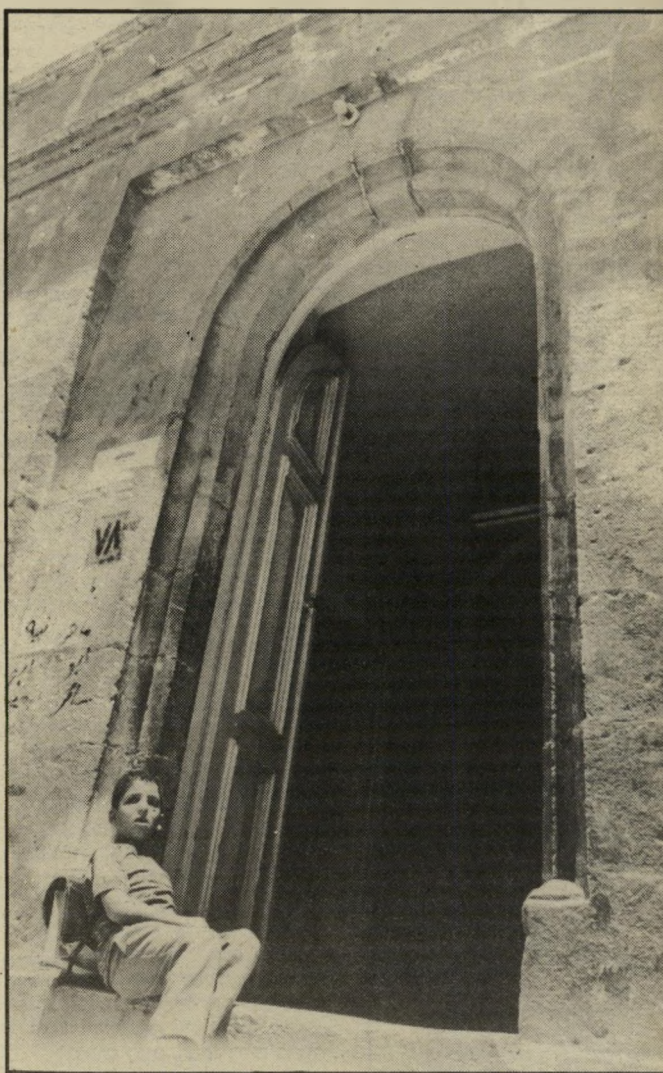
שער בית-החולים בוויאדולורוזה יסוריו של ישוע