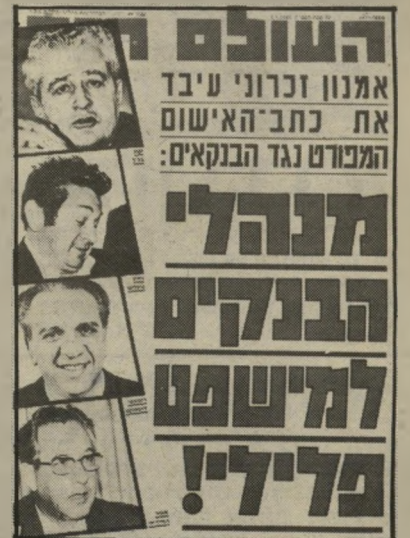
שער "העולם הזה" (9.1.85) אישום פלילי

שורה ארוכה של אנשי-כלכלה, ראשי בנקים ואנשי-מימשל בכירים, בעבר ובהווה,