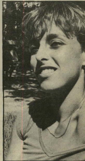
אתלטיה גונן אבא משוגע על ספורט!

סילבר הסביר שכנס-הבוגרים, בו היה אמור לשמש גיזבר, חשוב לו לקראת עתידו כקוורטר-באק, והוא צרק.