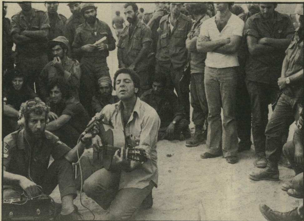
לנרד כהן עם חיילי צה"ל בתעלה במלחמת יום-כיפור זו היתה חוויית-חייהם

הוא אינו אלא הזמר לנרד כהן. המחזה הזה לא התרחש השבוע ולא יתרחש בשבוע הבא. בעת שהותו של לנרד כהן בישראל, הוא התרחש בתחילת 1974, זמן קצר אחרי פרוץ מל-חמת יום-הכיפורים.