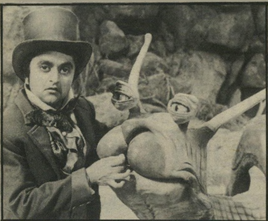
הננס וחילאון - הגבולות בין מציאות לדימיון

ומה שחשוב במיוחד: פיאלא יורד לשרשים של דמויות אלה, מעבר למציאות המיידית והאמינה מאוד שהוא מצייר.