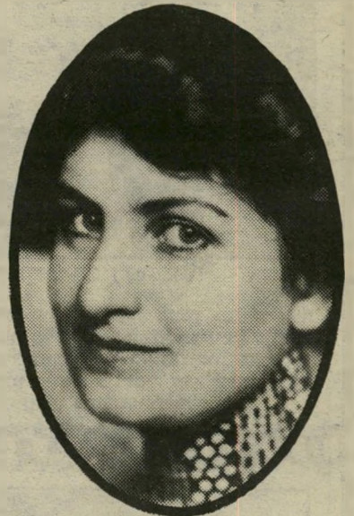
אלמה מאהלר וגם קוקושקה, גרופוס, ורפל